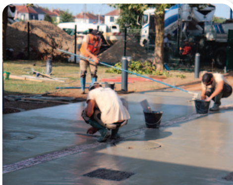
Dans le cadre de la renaturation de la cour de l'école du Centre (page 5), les agents de la voirie ont mis en place le mobilier urbain dédié à l'espace récréatif

Comme chaque été, une série de travaux a été engagée par les agents municipaux dans les différents bâtiments et espaces publics de la commune. Le Maire, selon son habitude en a fait le tour accompagné du Directeur des services techniques de la Ville.