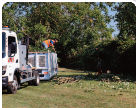
Taille des arbres et des haies à l'école du Village des Enfants.