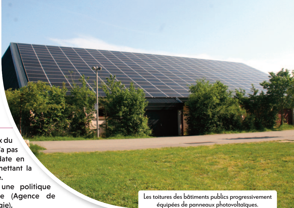
Les toitures des bâtiments publics progressivement équipées de panneaux photovoltaïques.

Face aux enjeux environnementaux cruciaux du réchauffement climatique, la collectivité n'a pas attendu. Elle agit en effet de longue date en mobilisant tous les leviers d'action permettant la transition sobre et durable de son territoire.