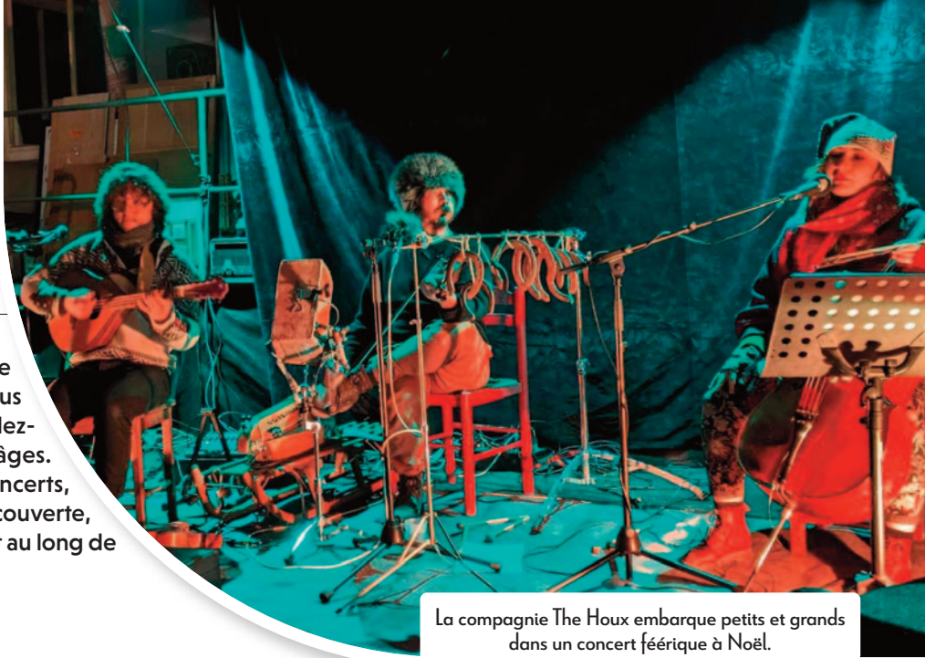
La compagnie The Houx embarque petits et grands dans un concert féérique à Noël.

Au 2e étage du bâtiment du Créa, l'équipe de la médiathèque est heureuse de vous retrouver pour une année pleine de rendez-vous « plaisir » ouverts à tous les âges. Conférences, spectacles, expositions, concerts, animations, le vent de la lecture, de la découverte, de la rencontre et du partage soufflera tout au long de l'année.