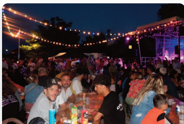
Le 13 juillet, une grande soirée festive et populaire a une nouvelle fois rassemblé des milliers d'habitants pour célébrer la Fête nationale au Park des Gravières.