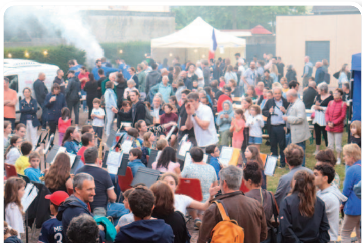
Le 21 juin, les habitants se sont retrouvés dans les rues du centre historique à l'occasion de la Fête de la musique.