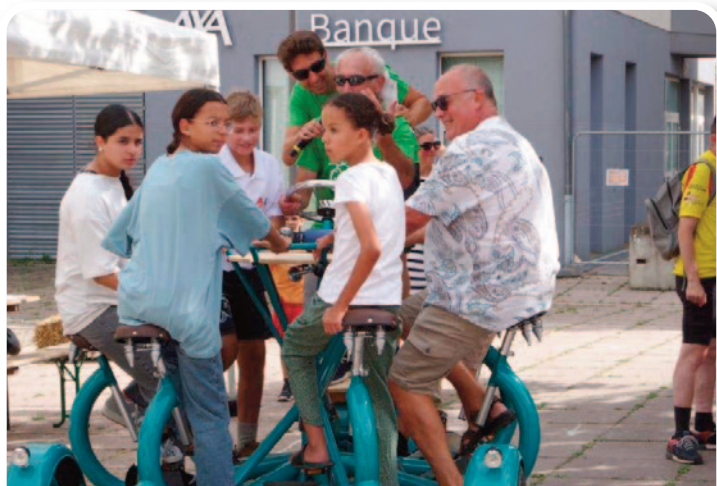
Le 7 septembre, une bourse aux vélos et diverses animations ludiques ont fait la part belle à la pratique de la bicyclette sur la place du Village.