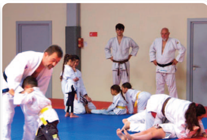
Le 7 septembre, les associations ont ouvert les portes des salles communales pour y faire la promotion de leurs activités et recueillir les dernières inscriptions.