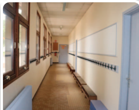
Rafrâchissement de la peinture dans les écoles.