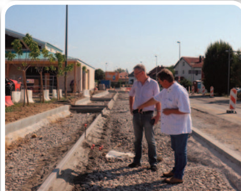
Poursuite des travaux de réaménagement de la voirie dans la rue de Richwiller.