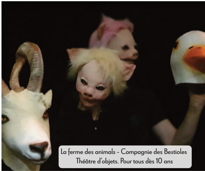
La ferme des animaux - Compagnie des Bestioles Théâtre d'objets. Pour tous dès 10 ans

Le Créa ouvre sa saison. A la tête de sa programmation, une nouvelle directrice artistique veille à préserver le supplément d'âme auquel vous êtes attachés tout en y imprimant une vision inspirée de sa riche et précieuse expérience de l'art vivant. Des spectacles pour tous, des temps de partage au plus près des artistes, des surprises et bien d'autres événements sont imaginés pour que la magie de la scène opère encore et toujours.