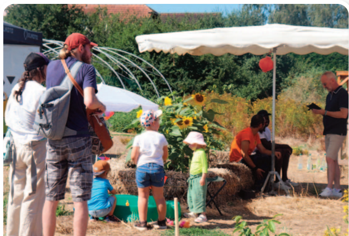
Le 10 août, l'association Écovie a organisé la 1ère fête d'été de la ferme botanique et pédagogique du quartier Gounod.