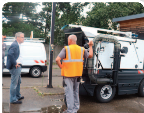
Une nouvelle balayeuse au service de la propreté de la ville.