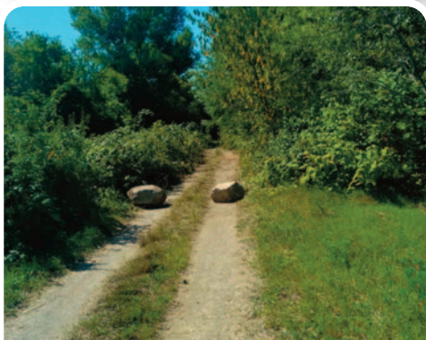
Nettoyage des abords de l'étang Nicola, près du karting.