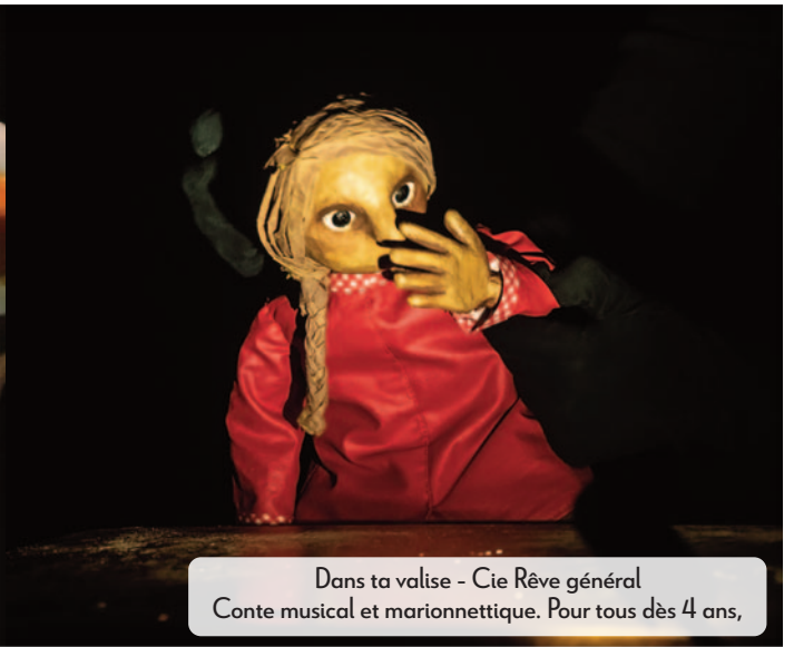
Dans ta valise - Cie Rêve général Conte musical et marionnette. Pour tous dès 4 ans,

Une saison entière de rêves et d'émotions invite les jeunes et les adultes de tous les horizons à venir piocher, sans modération, dans le large panel des pratiques et activités proposées par le Créa. Danse, théâtre, cirque, musique, les différentes disciplines artistiques enseignées dans la structure continuent d'être mises en valeur au travers de rendez-vous multiformes : résidences d'artistes, spectacles, expositions... Les animations de l'accueil de loisirs des mercredis et des vacances scolaires conçues par le pôle animation répondent une nouvelle fois à cet objectif double d'amuser et d'éveiller l'esprit des enfants et des adolescents. Ainsi, fidèle à ses valeurs, toute l'équipe signe une programmation soucieuse de préserver l'identité culturelle et sociale de la structure.