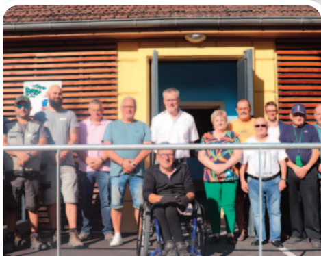
Une rampe d'accès pour personnes à mobilité réduite aménagée à la salle Fernand Anna.