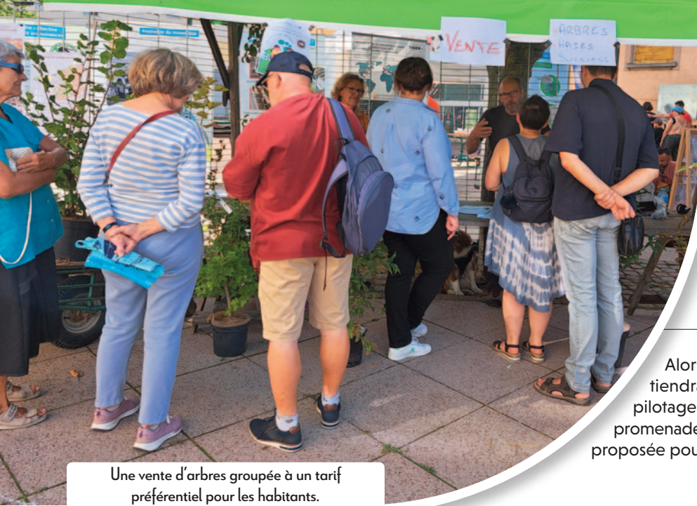
Une vente d'arbres groupée à un tarif préférentiel pour les habitants.