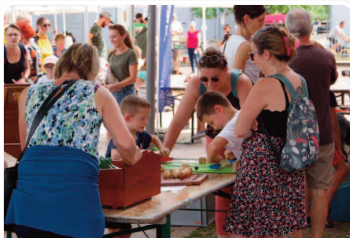
Le 7 septembre, la manifestation Kingersheim en Fête et Engagée a rassemblé les habitants comme chaque année dans l'esprit de la Fête des rues.