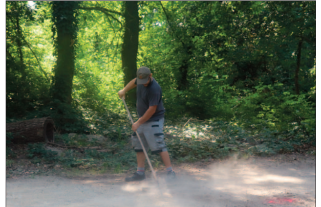
Au parcours de santé, après une coupe d'arbres nécessaire à cause de la sécheresse, la nature va peu à peu reprendre ses droits. Après l'intervention de l'ONF (Office national des forêts), les agents de la Ville ont remis en état les différents sentiers du site.