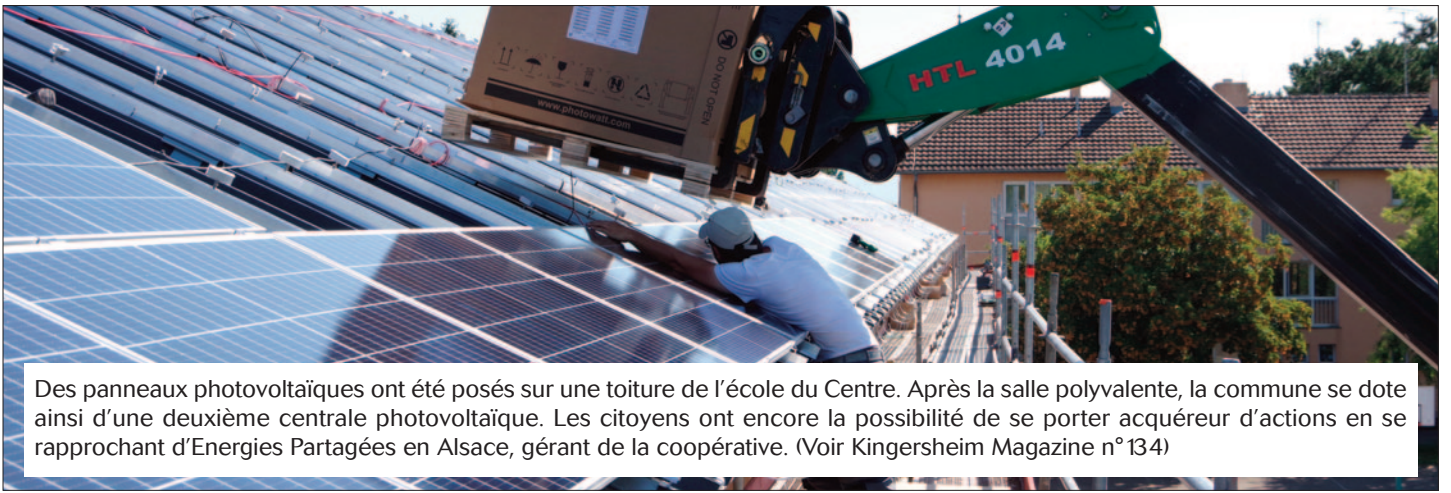
Des panneaux photovoltaïques ont été posés sur une toiture de l'école du Centre. Après la salle polyvalente, la commune se dote ainsi d'une deuxième centrale photovoltaïque. Les citoyens ont encore la possibilité de se porter acquéreur d'actions en se rapprochant d'Energies Partagées en Alsace, gérant de la coopérative. (Voir Kingersheim Magazine n° 134)