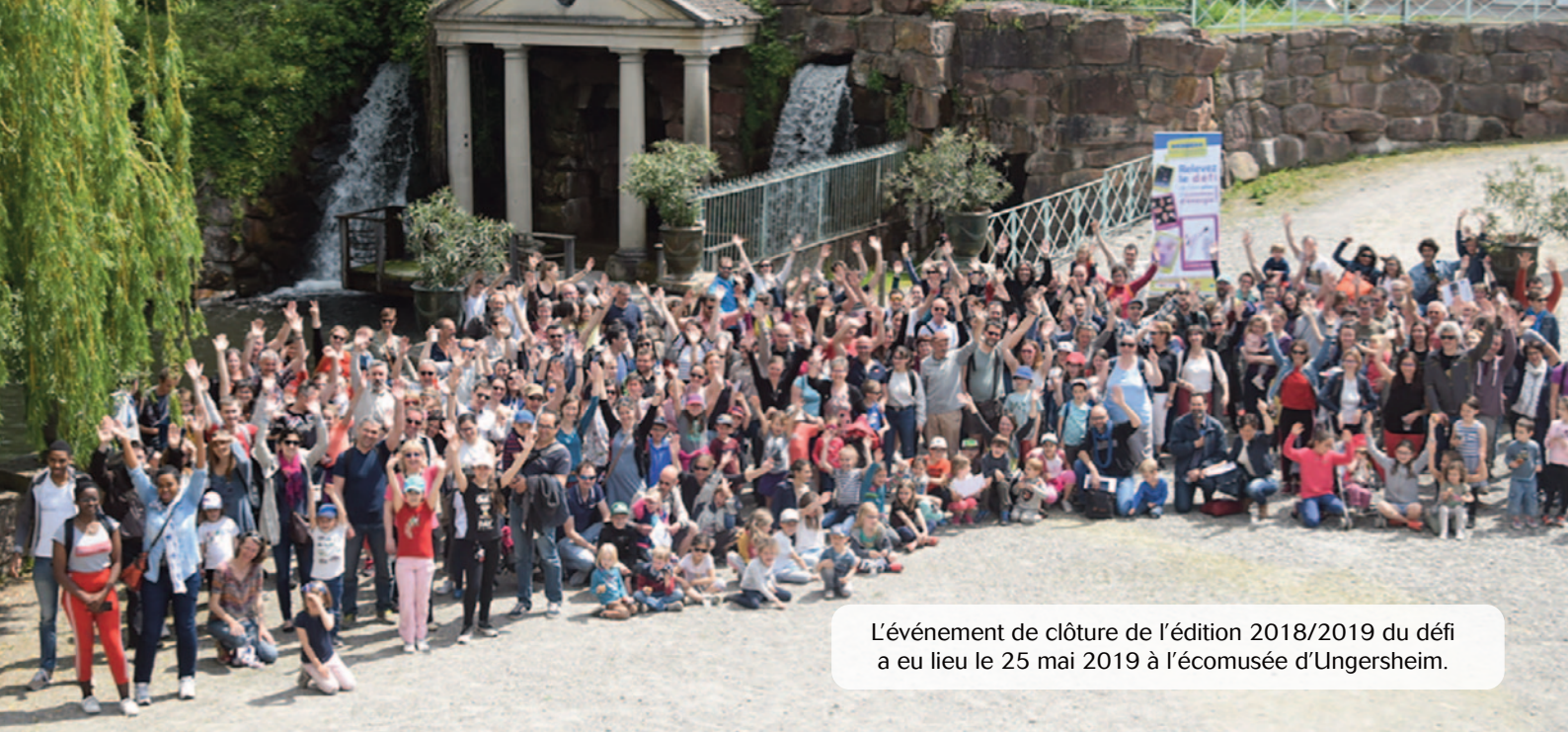
L'événement de clôture de l'édition 2018/2019 du défi a eu lieu le 25 mai 2019 à l'écomusée d'Ungersheim.