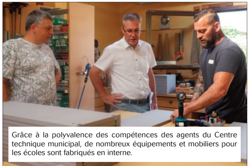
Grâce à la polyvalence des compétences des agents du Centre technique municipal, de nombreux équipements et mobiliers pour les écoles sont fabriqués en interne.