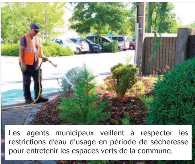
Les agents municipaux veillent à respecter les restrictions d'eau d'usage en période de sécheresse pour entretenir les espaces verts de la commune.