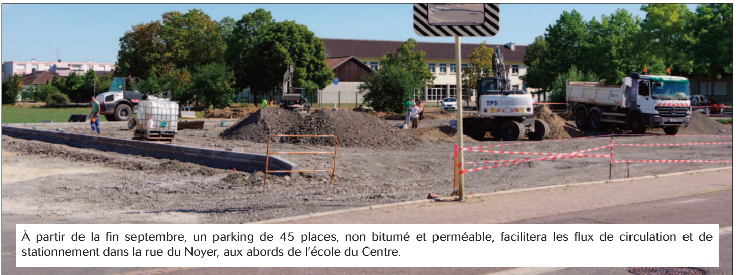
À partir de la fin septembre, un parking de 45 places, non bitumé et perméable, facilitera les flux de circulation et de stationnement dans la rue du Noyer, aux abords de l'école du Centre.