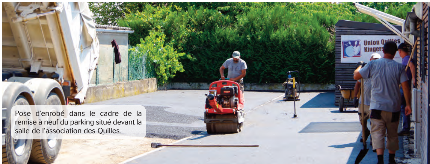
Pose d'enrobé dans le cadre de la remise à neuf du parking situé devant la salle de l'association des Quilles.