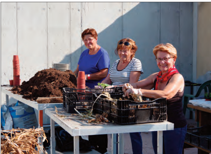
Les dames ont confectionné des arrangements floraux pour les personnes âgées de l'EHPAD Les Violettes.