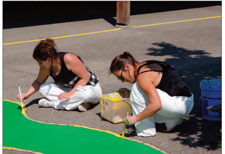
La peinture des jeux au sol de la cour de l'école maternelle Louise Michel a été minutieusement rafraîchie.