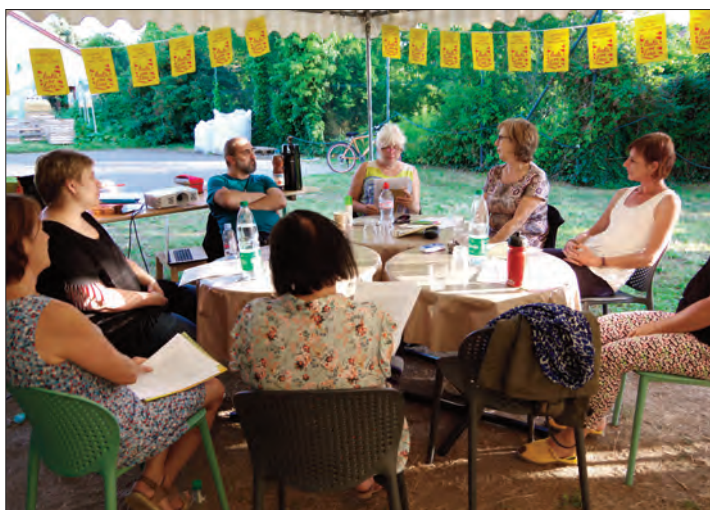
Un marathon de lecture invitant à lire « ensemble » et à « voix haute », un roman mystère au cours de deux séances de quatre heures.