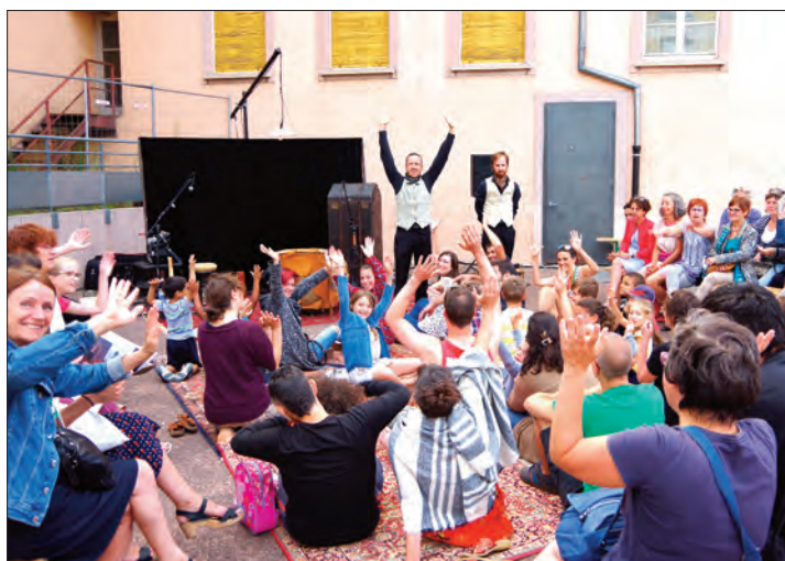
[Sherlock Holmes], son dernier coup d'archet de rue de la Cie Ô, un spectacle participatif présenté en partenariat avec Scènes de rue à Mulhouse.