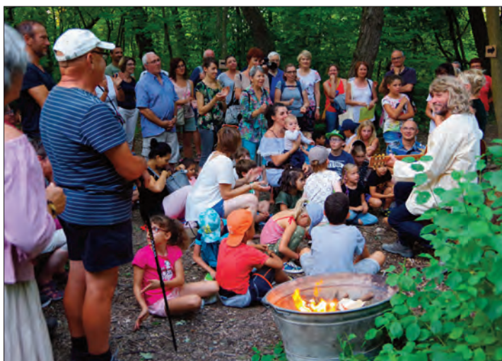
Un spectacle de clôture donné par la Cie Les Contes de Nana au coeur du Poumon Vert.