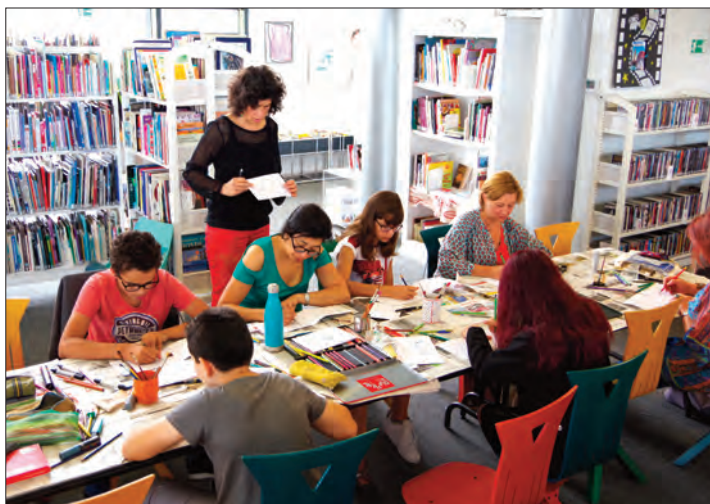
Des ateliers ouverts au grand public afin de lui faire découvrir les secrets de l'illustration.