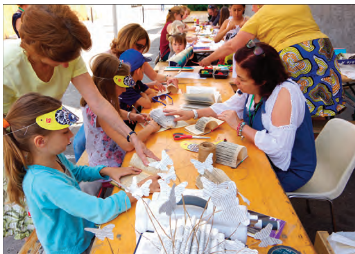
Des séquences de pliage et de réalisation de cartes postales.