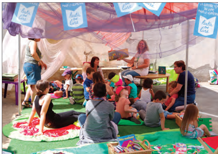
Des temps proposant de partager et de transmettre l'amour des mots et des images aux enfants.

Ateliers, lectures, rencontres avec des auteurs et des libraires, jeux, expositions, les bibliothécaires ont eu à cœur de mettre à l'honneur l'actualité littéraire pour la jeunesse et de proposer des animations aussi originales les unes que les autres.