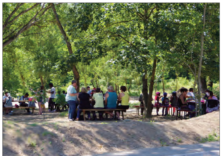
À la fin des chantiers, les participants se sont retrouvés au Poumon Vert pour le traditionnel barbecue convivial.