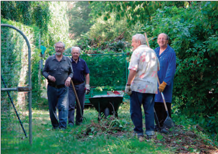
Les abords du Dollerbaechlein ont été bénévolement nettoyés, bonne humeur en prime !

La 7ème édition de la Journée Citoyenne s'est déroulée le samedi 30 juin dernier. A cette occasion, des travaux d'entretien et de rénovation des bâtiments et espaces verts publics ont été organisés. Les Kingersheimois ont une nouvelle fois habillé leur ville d'une dimension fraternelle notamment en invitant de jeunes migrants hébergés dans la commune à participer à l'événement. Et pour la première fois, le barbecue géant a eu lieu au cœur du Poumon vert !