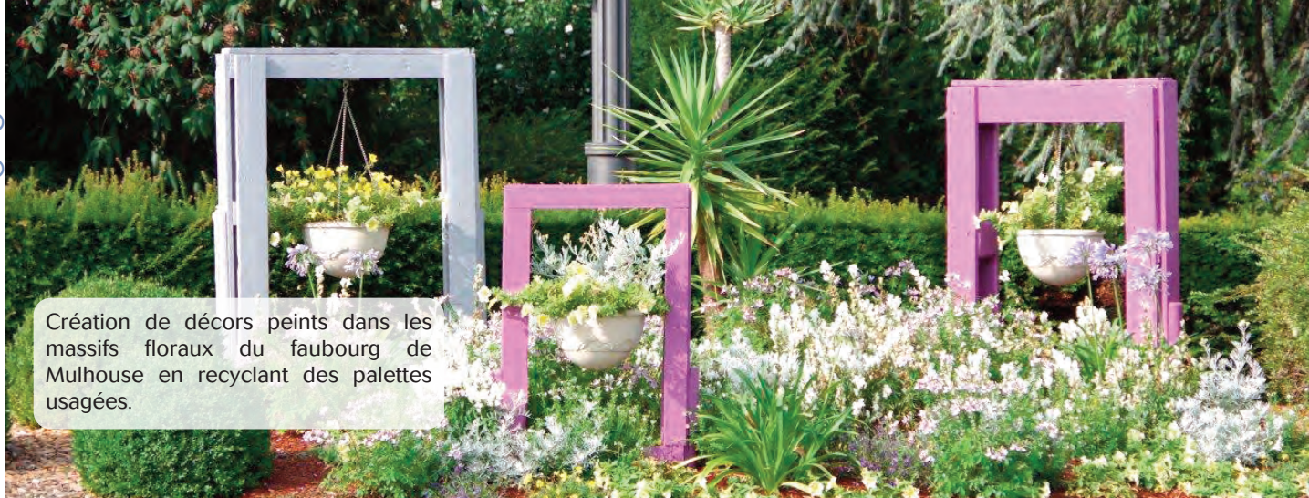
Création de décors peints dans les massifs floraux du faubourg de Mulhouse en recyclant des palettes usagées.