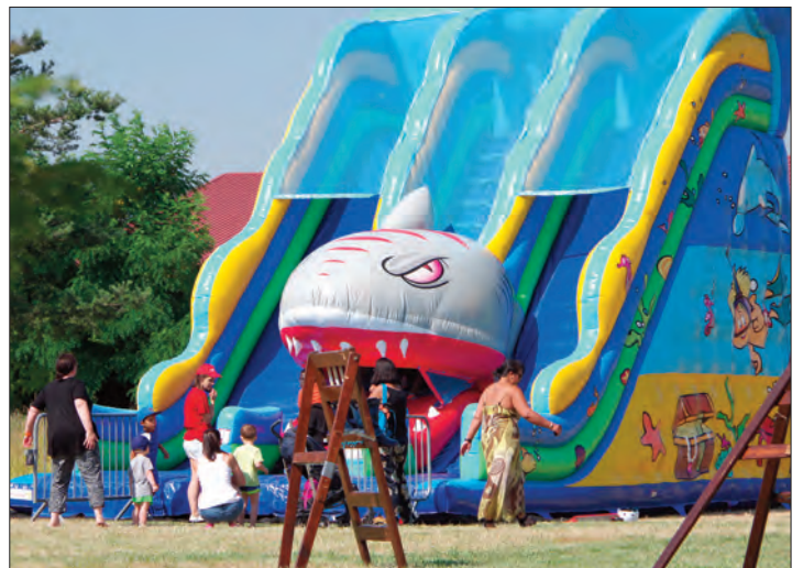
En même temps, les animations de K'rtiers d'été proposées par le Créa battaient leur plein au parK des Gravières !