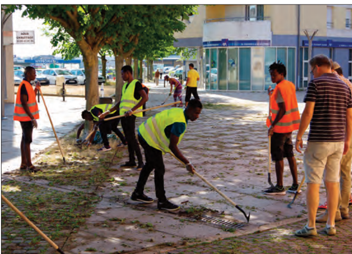
Les jeunes migrants hébergés dans un hôtel du Kaligone sont venus prêter main forte aux habitants pour le désherbage de la cour Tival.