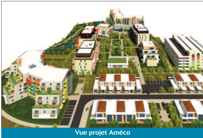
Vue projet Améco

Les élus ont été invités à délibérer sur une modification du PLU (Plan local d'urbanisme) préconisée dans le cadre de l'enquête publique concernant l'urbanisation de deux zones en devenir : Ameco et Vert Village 2.