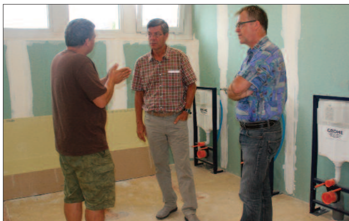
A l'école des Perdrix, les sanitaires situés sous le préau du bâtiment B ont été refaits à neuf. Plâtrerie, carrelage, menuiserie, ventilation, électricité, ce chantier de rénovation a également pris en compte l'accessibilité des Etablissements Recevant du Public (ERP) imposant une mise aux normes pour les personnes handicapées.