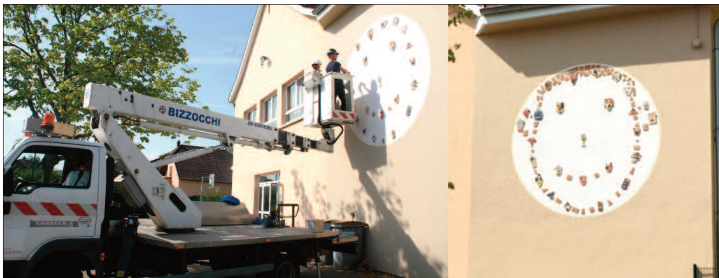
Préparation de la façade de l'école des Perdrix (nettoyage + primaire d'accrochage) avant la mise en place de la fresque en carreaux céramiques réalisée par les élèves dans le cadre du Projet éducatif territorial (PEDT) faisant l'objet d'un partenariat entre la Ville et le Créa.