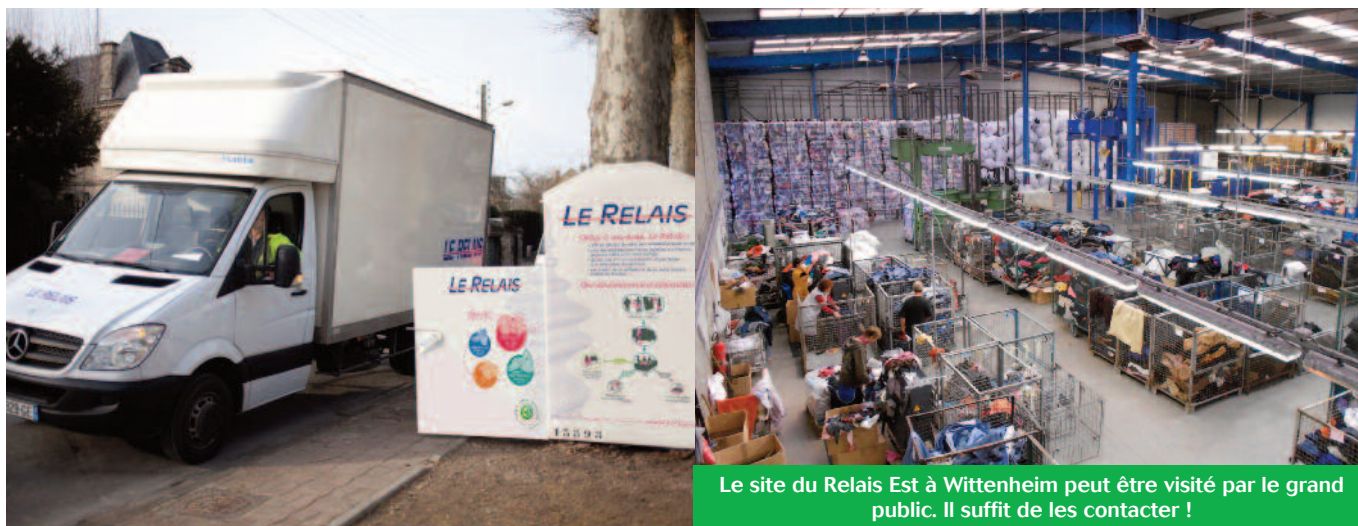
Le site du Relais Est à Wittenheim peut être visité par le grand public. Il suffit de les contacter !

La Ville souhaite renforcer le dispositif mis à disposition des particuliers pour les encourager à donner plutôt que de jeter ! Kingersheim Magazine vous explique en quoi c'est un acte écologique et solidaire.