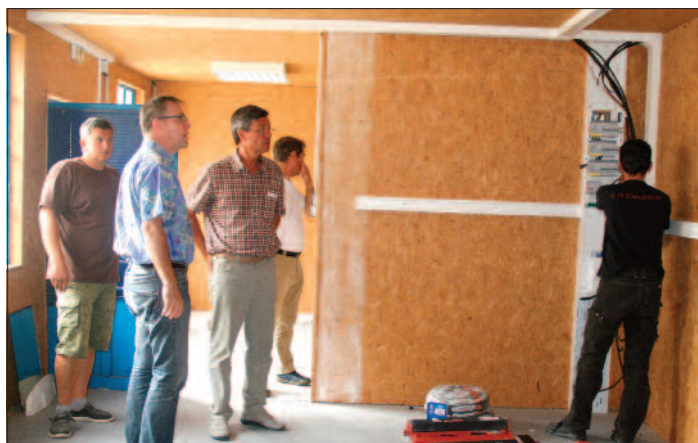
Des travaux de réhabilitation électrique ont été réalisés dans le bâtiment situé au 19 rue de Hirschau qui sera mis à disposition de l'association Le Fala (Faire Avec Les Autres). Elle y développera prochainement une activité à vocation écologique basée sur le réemploi, le recyclage et la récupération ouverte à tous.