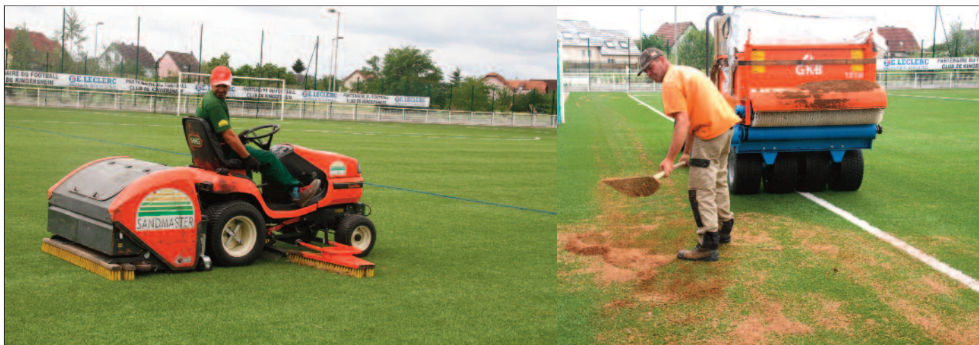
Les deux terrains synthétiques de la Plaine de Foot et de Loisirs ont fait l'objet d'une opération de nettoyage et de remplissage consistant à « regarnir » le tapis vert d'une matière composée de liège, de fibre de coco et de cosse de riz. Cette intervention spécifique doit permettre d'éviter l'usure causée lors des entraînements et des matchs disputés durant l'année.