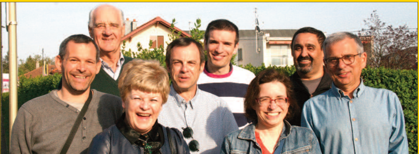
Les membres du Conseil Citoyen « Eclairer au plus juste ».

Une fois de plus, fidèle à l'état d'esprit des États-Généraux Permanents de la Démocratie, Kingersheim cherche à associer les habitants à une prise de décision les concernant directement. En l'occurrence, le débat porte sur la possibilité de réduire l'éclairage public.