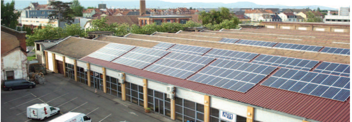
Dans le cadre d'une coopération transfrontalière, un projet de même nature a pu être mené grâce à Energies partagées en Alsace.

C'est une première à Kingersheim et plus largement dans l'agglomération mulhousienne ! Une coopérative propose aux habitants de devenir actionnaires d'une petite centrale de production d'énergie qui va s'installer sur la toiture de la salle polyvalente. Kingersheim Magazine vous explique comment.