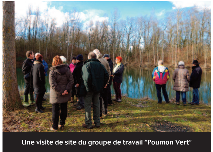
Une visite de site du groupe de travail "Poumon Vert"

Compte tenu de l'importance des mesures environnementales prises dans la commune depuis plusieurs années, Kingersheim Magazine a choisi d'apporter régulièrement à ses lecteurs un éclairage concret sur la mise en œuvre du processus de labellisation Cit'ergie qui rassemble aujourd'hui près de 120 collectivités en France (représentant près de 12,2 millions d'habitants). Ce label sera attribué à la Ville si elle est en mesure au bout de quatre ans, de faire reconnaître la qualité et la performance de son action en matière de transition énergétique.