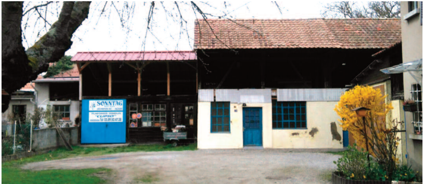
Le bâtiment situé au 19 rue de Hirschau est en passe de se transformer en un espace d'échanges collaboratifs. L'ouverture est prévue pour le mois d'octobre 2017

Lors du Conseil municipal du mois de mars dernier, la création du FaLa, un nouveau lieu d'intérêt général, de partage et d'échange de pratiques, a été validée. C'est le groupe d'habitants qui en est chargé qui en a présenté les objectifs et les enjeux aux élus.