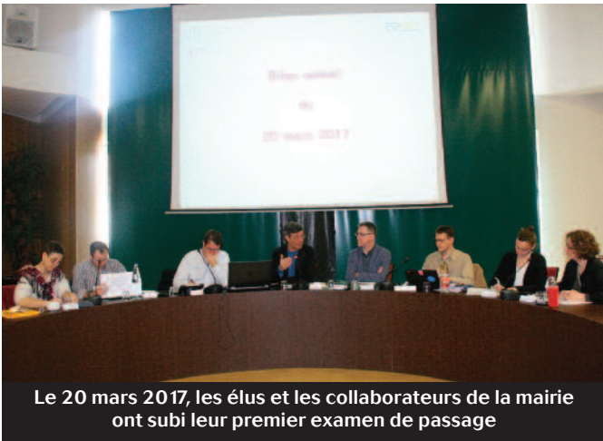
Le 20 mars 2017, les élus et les collaborateurs de la mairie ont subi leur premier examen de passage

Mobilisée de longue date pour la transition énergétique et écologique du territoire, Kingersheim est engagée depuis 2015 dans une démarche d'excellence appelée Cit'ergie. Un audit annuel a permis de faire récemment un point d'étape sur son avancement.