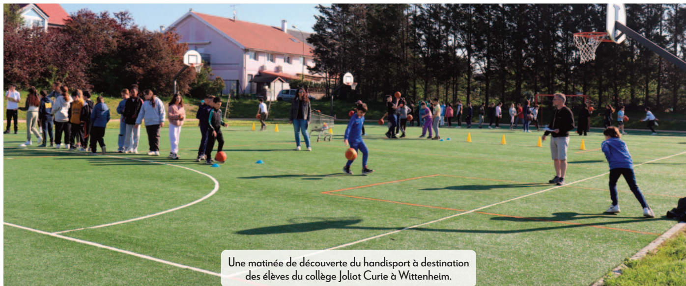
Une matinée de découverte du handisport à destination des élèves du collège Joliot Curie à Wittenheim.

Kingersheim Magazine revient sur quelques-uns des dossiers examinés par les élus lors de la séance du Conseil municipal du 27 mars dernier.