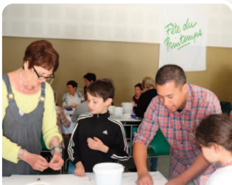
Préparation des décorations du Marché de Noël.