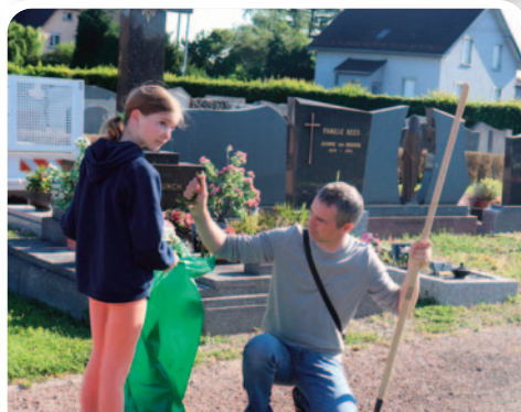
Désherbage du cimetière nord.