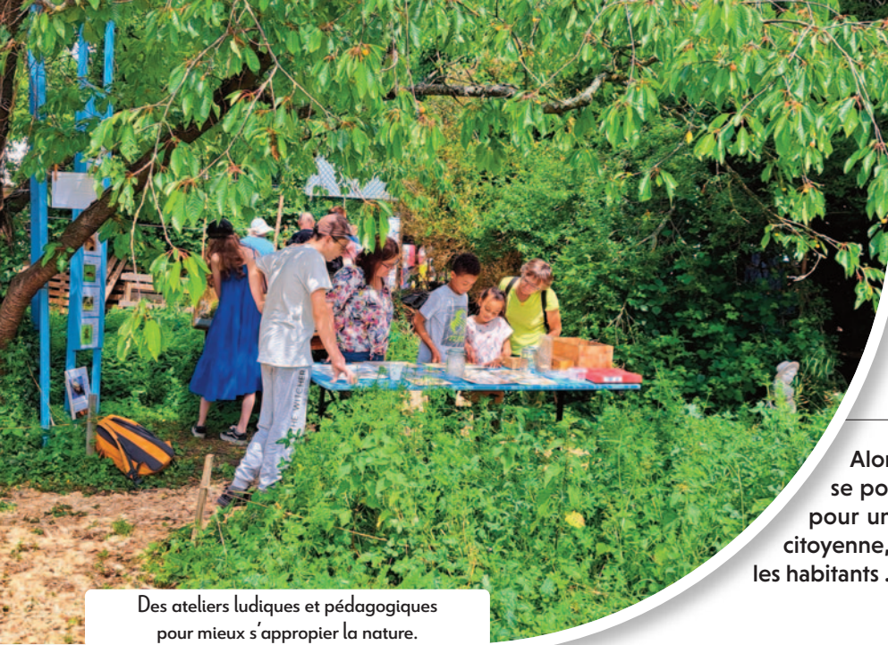
Des ateliers ludiques et pédagogiques pour mieux s'approprier la nature.