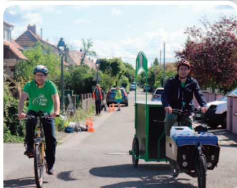
Ravitaillement des chantiers par le copil Vélo et Marche.