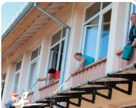
Nettoyage des panneaux photovoltaïques de l'école du Centre.