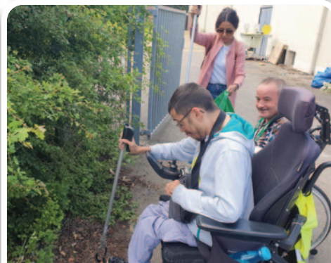
Chantier inclusif pour la résidence adaptée Le Phénix.