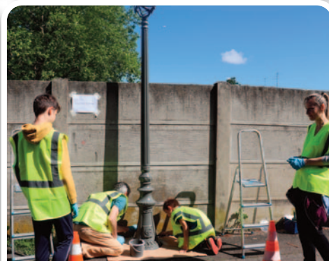
Peinture des lampadaires du quartier Fernand Anna.