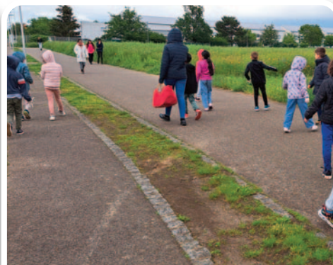
Nettoyage des abords de l'école du Village des Enfants.