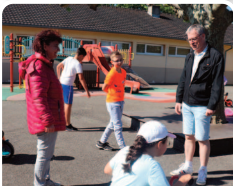
Garderie à la maternelle Louise Michel.