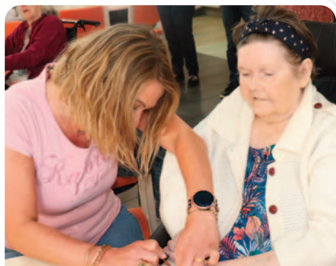
Atelier bien-être seniors.

Kingersheim a une nouvelle fois relevé le défi de l'entraide et de la solidarité avec une édition de la Journée citoyenne très réussie rassemblant près de 300 participants le samedi 25 mai et 375 écoliers et collégiens durant la semaine qui a précédé.