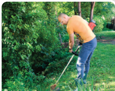
Nettoyage des rives du Dollerbaechlein.