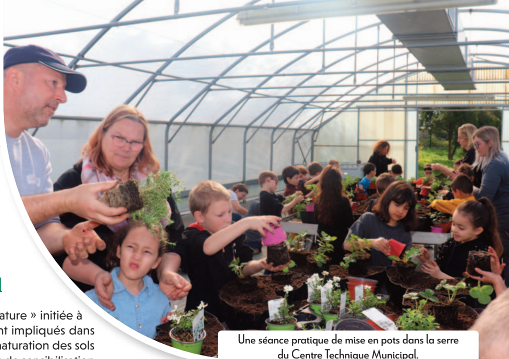
Une séance pratique de mise en pots dans la serre du Centre Technique Municipal.

Comme elle s'y était engagée, l'association Ecovie y a démarré ses activités de maraîchage et d'arboriculture fruitière dans le but de proposer aux habitants de Kingersheim des fruits et légumes de saison et cultivés sur place. Au-delà de ce point de vente de