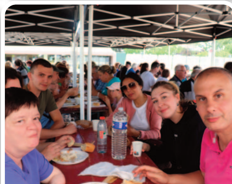
Barbecue convivial à la fin des chantiers.