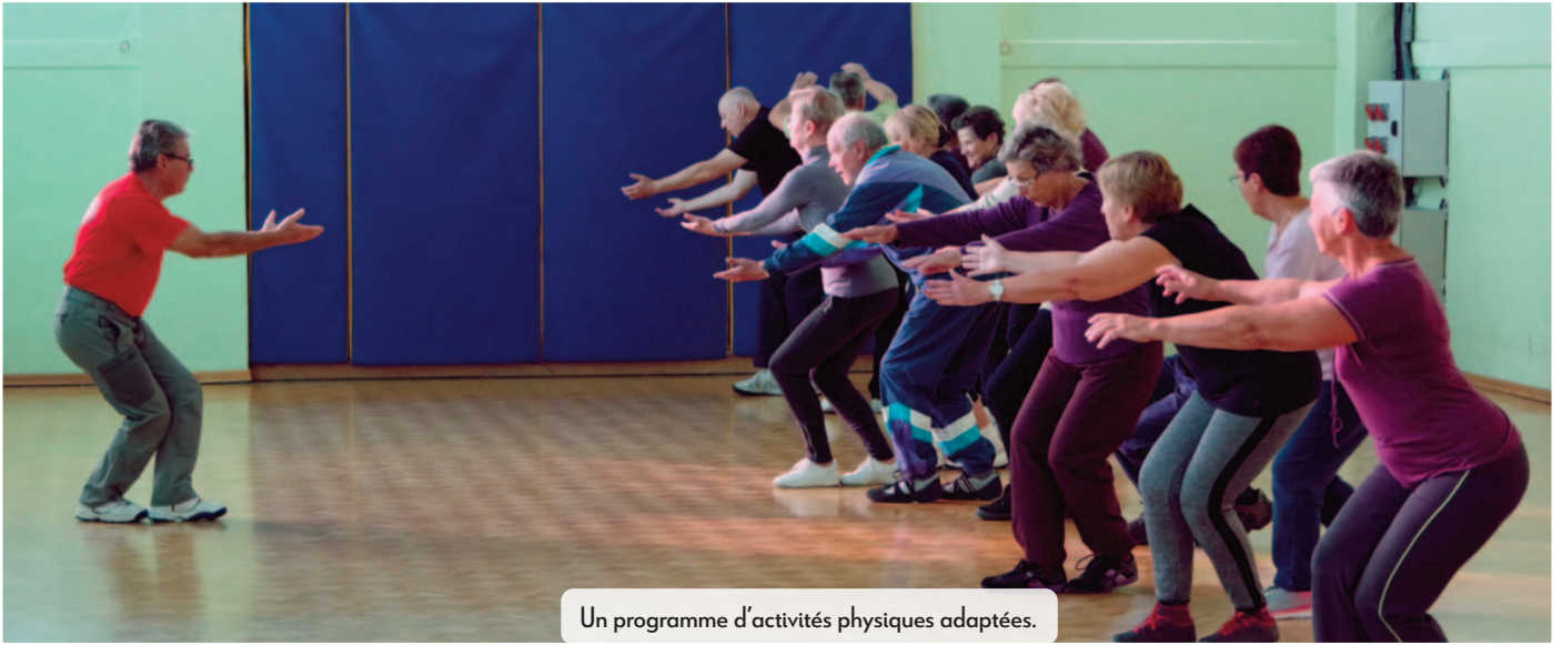
Un programme d'activités physiques adaptées.