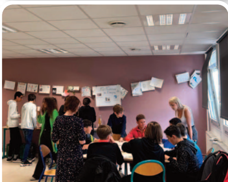
Sensibilisation des collégiens à la citoyenneté.