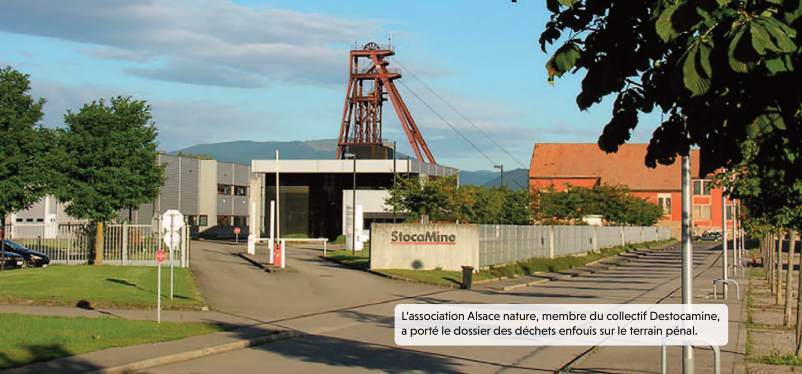
L'association Alsace nature, membre du collectif Destocamine, a porté le dossier des déchets enfouis sur le terrain pénal.