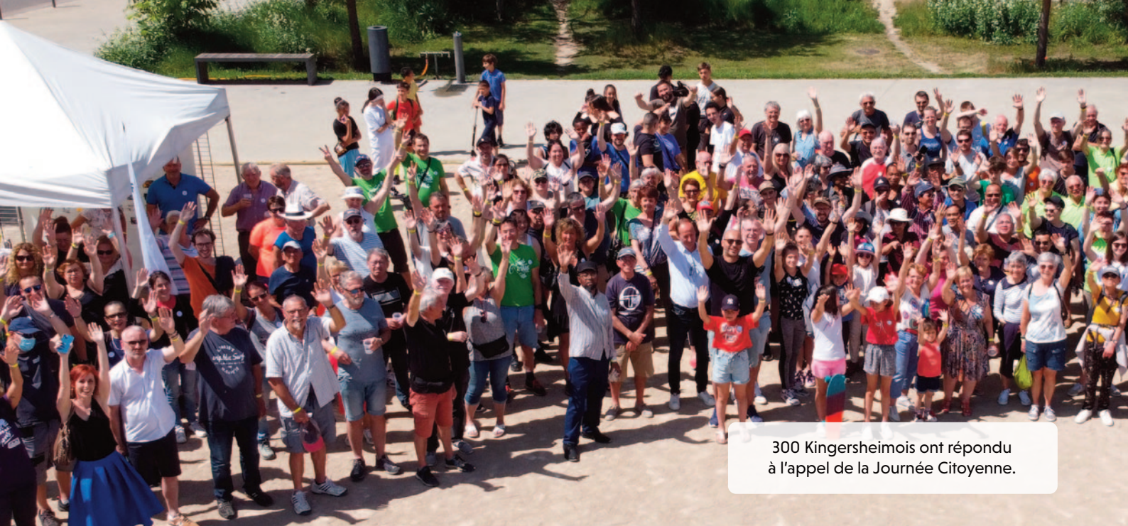
300 Kingersheimois ont répondu à l'appel de la Journée Citoyenne.