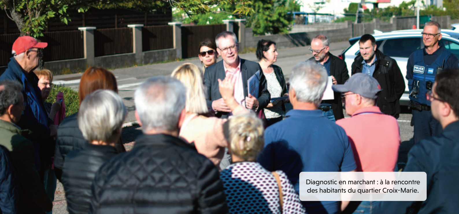
Diagnostic en marchant : à la rencontre des habitants du quartier Croix-Marie.