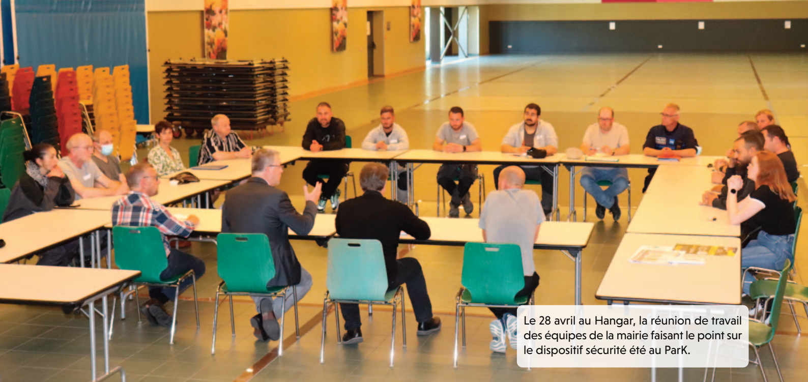
Le 28 avril au Hangar, la réunion de travail des équipes de la mairie faisant le point sur le dispositif sécurité été au ParK.