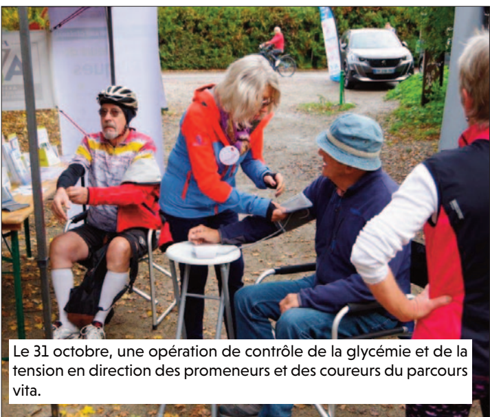
Le 31 octobre, une opération de contrôle de la glycémie et de la tension en direction des promeneurs et des coureurs du parcours vita.