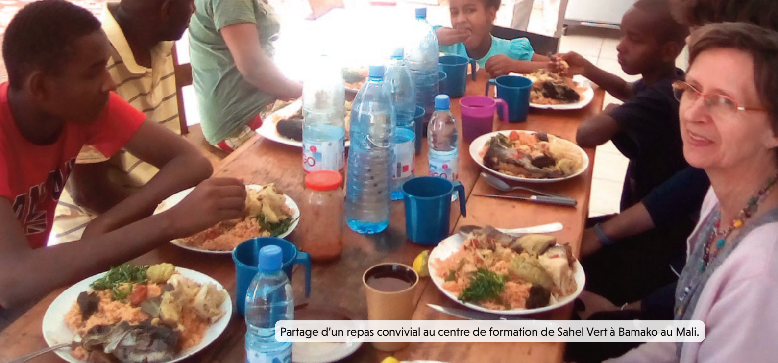
Partage d'un repas convivial au centre de formation de Sahel Vert à Bamako au Mali.