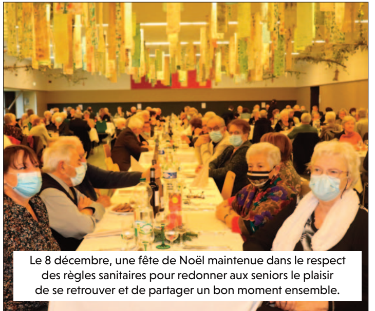
Le 8 décembre, une fête de Noël maintenue dans le respect des règles sanitaires pour redonner aux seniors le plaisir de se retrouver et de partager un bon moment ensemble.