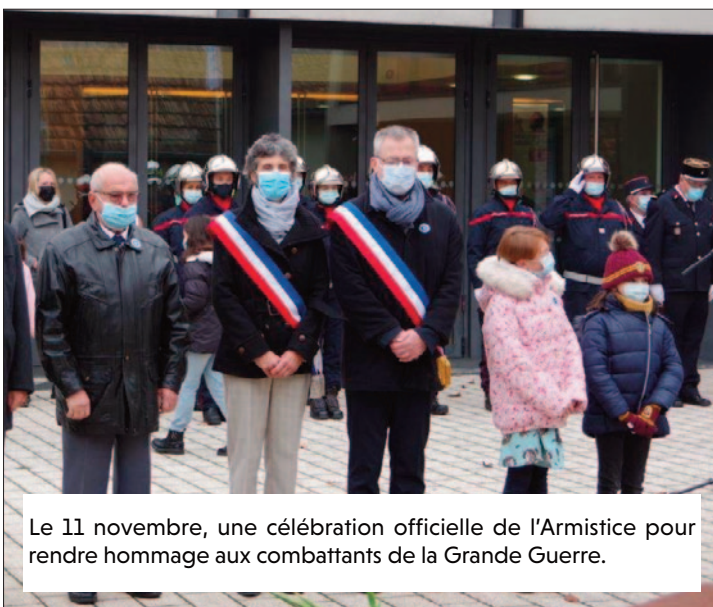
Le 11 novembre, une célébration officielle de l'Armistice pour rendre hommage aux combattants de la Grande Guerre.