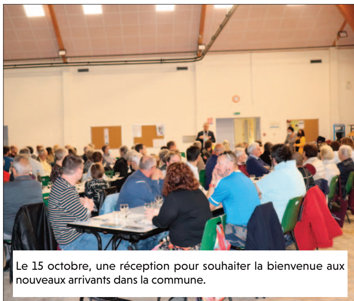
Le 15 octobre, une réception pour souhaiter la bienvenue aux nouveaux arrivants dans la commune.