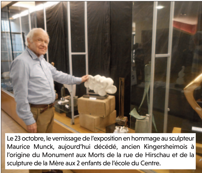
Le 23 octobre, le vernissage de l'exposition en hommage au sculpteur Maurice Munk, aujourd'hui décédé, ancien Kingersheimois à l'origine du Monument aux Morts de la rue de Hirschau et de la sculpture de la Mère aux 2 enfants de l'école du Centre.