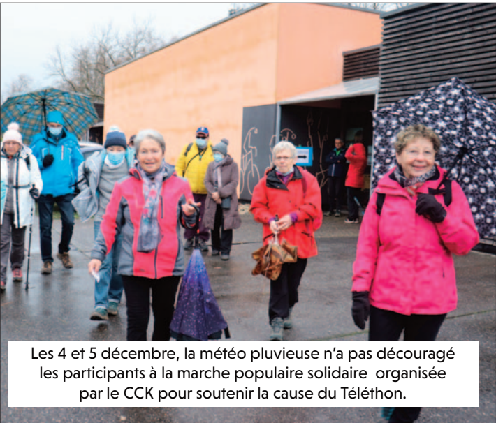
Les 4 et 5 décembre, la météo pluvieuse n'a pas découragé les participants à la marche populaire solidaire organisée par le CCK pour soutenir la cause du Téléthon.