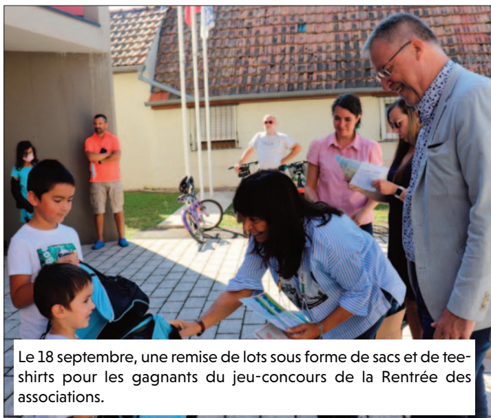
Le 18 septembre, une remise de lots sous forme de sacs et de tee-shirts pour les gagnants du jeu-concours de la Rentrée des associations.