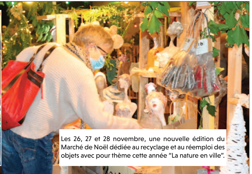
Les 26, 27 et 28 novembre, une nouvelle édition du Marché de Noël dédiée au recyclage et au réemploi des objets avec pour thème cette année "La nature en ville".