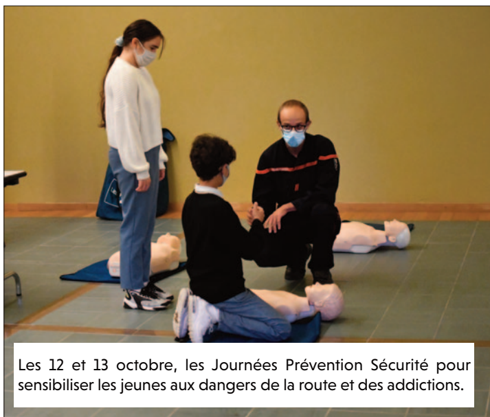
Les 12 et 13 octobre, les Journées Prévention Sécurité pour sensibiliser les jeunes aux dangers de la route et des addictions.