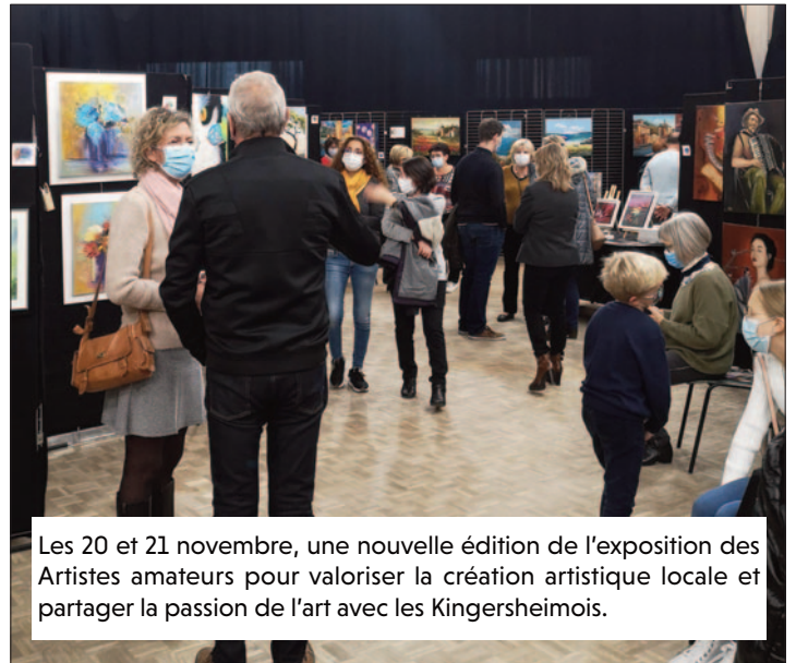
Les 20 et 21 novembre, une nouvelle édition de l'exposition des Artistes amateurs pour valoriser la création artistique locale et partager la passion de l'art avec les Kingersheimois.