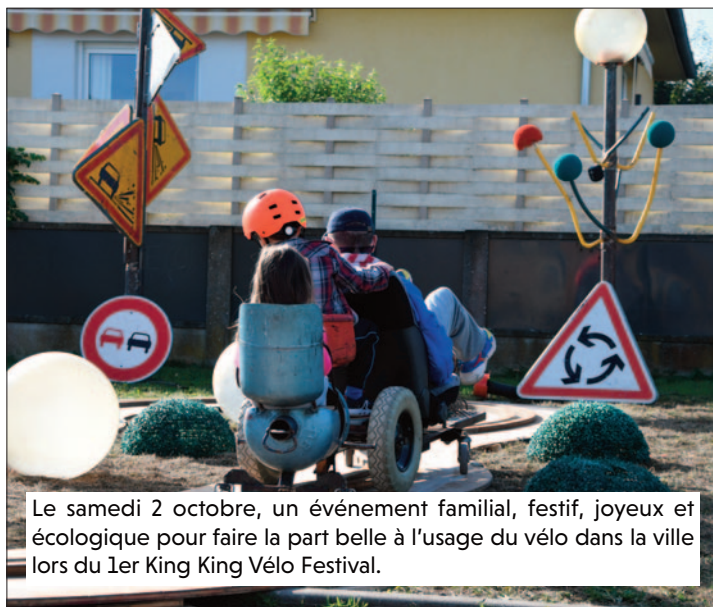
Le samedi 2 octobre, un événement familial, festif, joyeux et écologique pour faire la part belle à l'usage du vélo dans la ville lors du 1er King King Vélo Festival.