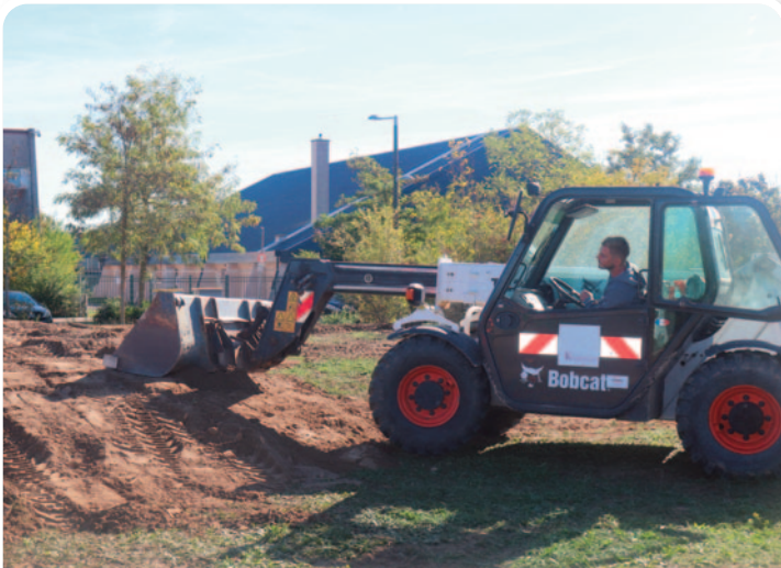
Au park des Gravières : Création d'un talus en terre pour préparer de futures plantations d'arbres sur le site.