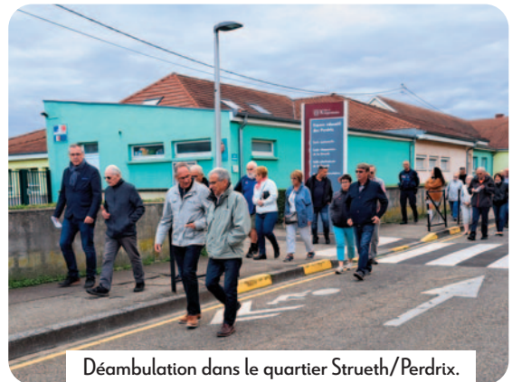
Déambulation dans le quartier Strueth/Perdrix.

Ce format permet d'apporter certaines réponses immédiatement. Dans certains cas, les discussions débouchent sur des propositions d'expérimentation par exemple lorsque les doléances concernent des aménagements routiers. Dans d'autres, les problèmes évoqués prennent plus de temps à être résolus notamment lorsqu'il s'agit de changer les comportements tels que les incivilités. Suite à ces rencontres, les habitants des quartiers concernés sont destinataires d'un compte-rendu reprenant les différents sujets exprimés ainsi que les réponses qui sont apportées.