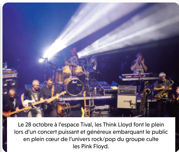
Le 28 octobre à l'espace Tival, les Think Lloyd font le plein lors d'un concert puissant et généreux embarquant le public en plein cœur de l'univers rock/pop du groupe culte les Pink Floyd.