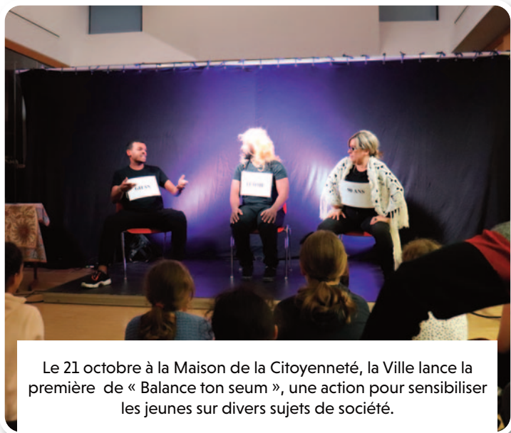
Le 21 octobre à la Maison de la Citoyenneté, la Ville lance la première de « Balance ton seum », une action pour sensibiliser les jeunes sur divers sujets de société.