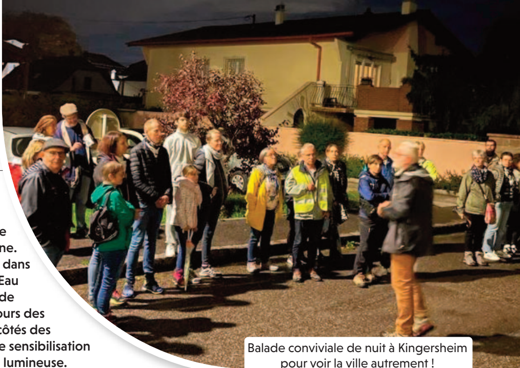
Balade conviviale de nuit à Kingersheim pour voir la ville autrement !

La Ville développe une politique très volontariste et encourage cette dynamique le plus largement possible dans la commune. Au groupe scolaire du Centre, elle s'inscrit dans le dispositif Bulle Nature de l'Agence de l'Eau Rhin Meuse afin de développer un projet de création de zones de fraîcheurs dans les cours des écoles Louise Michel et Paul Claudel. Aux côtés des habitants, elle s'engage dans une action de sensibilisation aux conséquences néfastes de la pollution lumineuse. Kingersheim Magazine vous en parle.