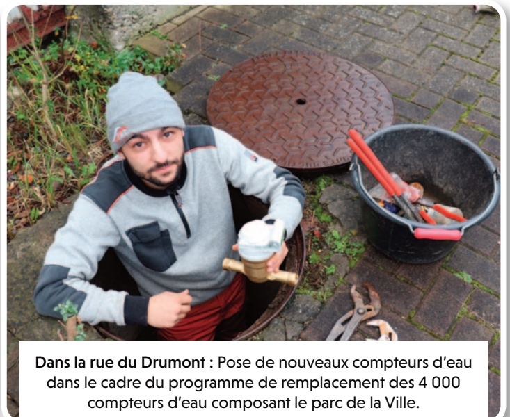
Dans la rue du Drumont : Pose de nouveaux compteurs d'eau dans le cadre du programme de remplacement des 4 000 compteurs d'eau composant le parc de la Ville.