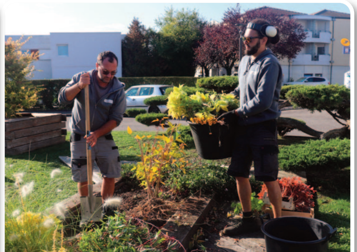
Place de la mairie : Arrachage des massifs et préparation de la terre dans le cadre de l'entretien annuel des espaces verts de la commune.