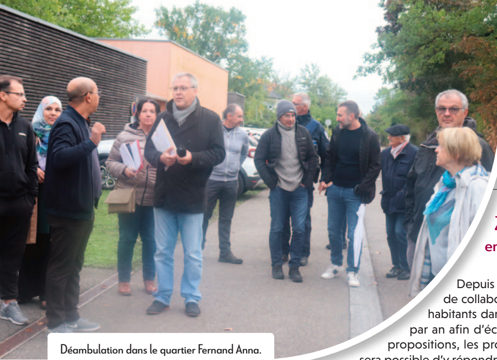
Déambulation dans le quartier Fernand Anna.