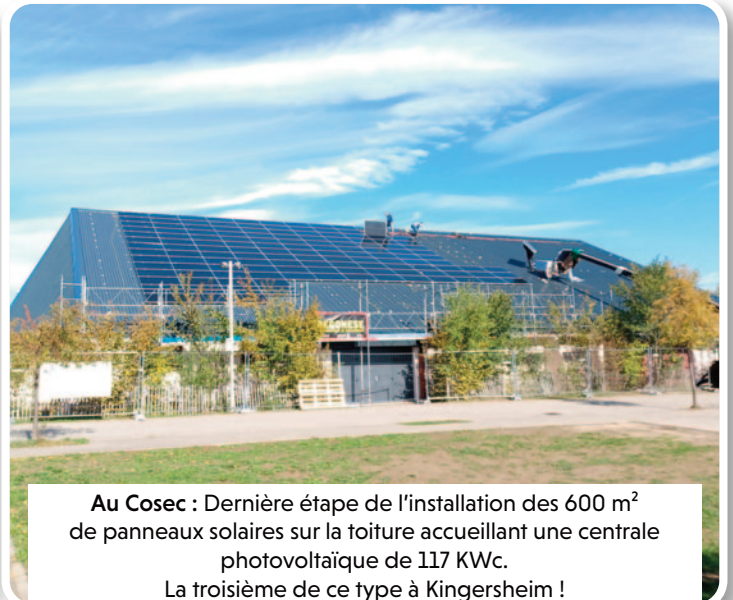
Au Coséc : Dernière étape de l'installation des 600 m 2 de panneaux solaires sur la toiture accueillant une centrale photovoltaïque de 117 KWc. La troisième de ce type à Kingersheim !