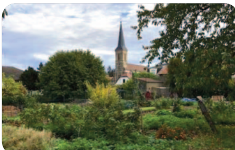
Les couleurs dorment la nuit...