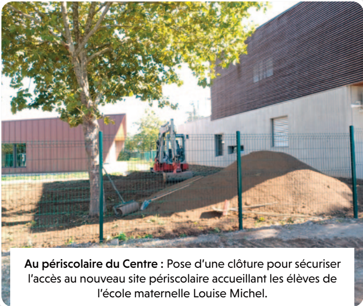
Au périscolaire du Centre : Pose d'une clôture pour sécuriser l'accès au nouveau site périscolaire accueillant les élèves de l'école maternelle Louise Michel.