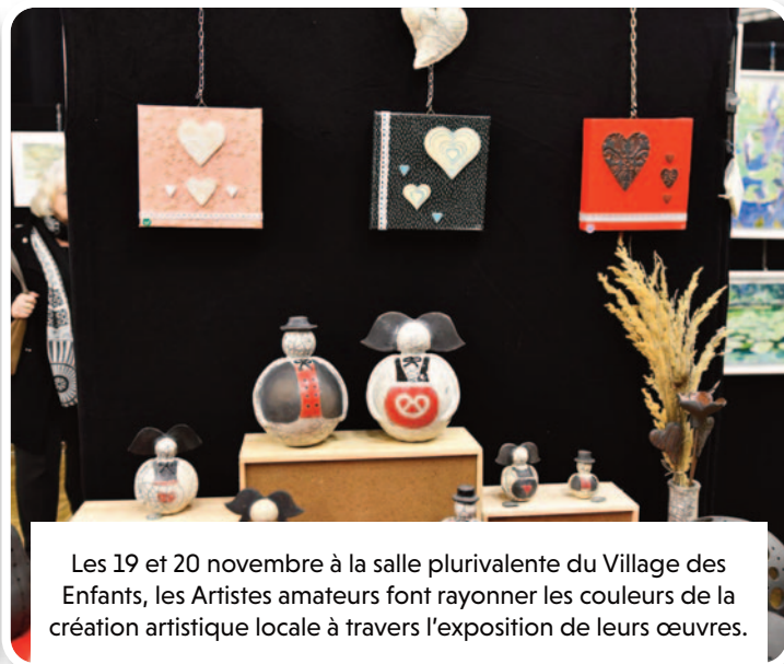
Les 19 et 20 novembre à la salle plurivalente du Village des Enfants, les Artistes amateurs font rayonner les couleurs de la création artistique locale à travers l'exposition de leurs œuvres.