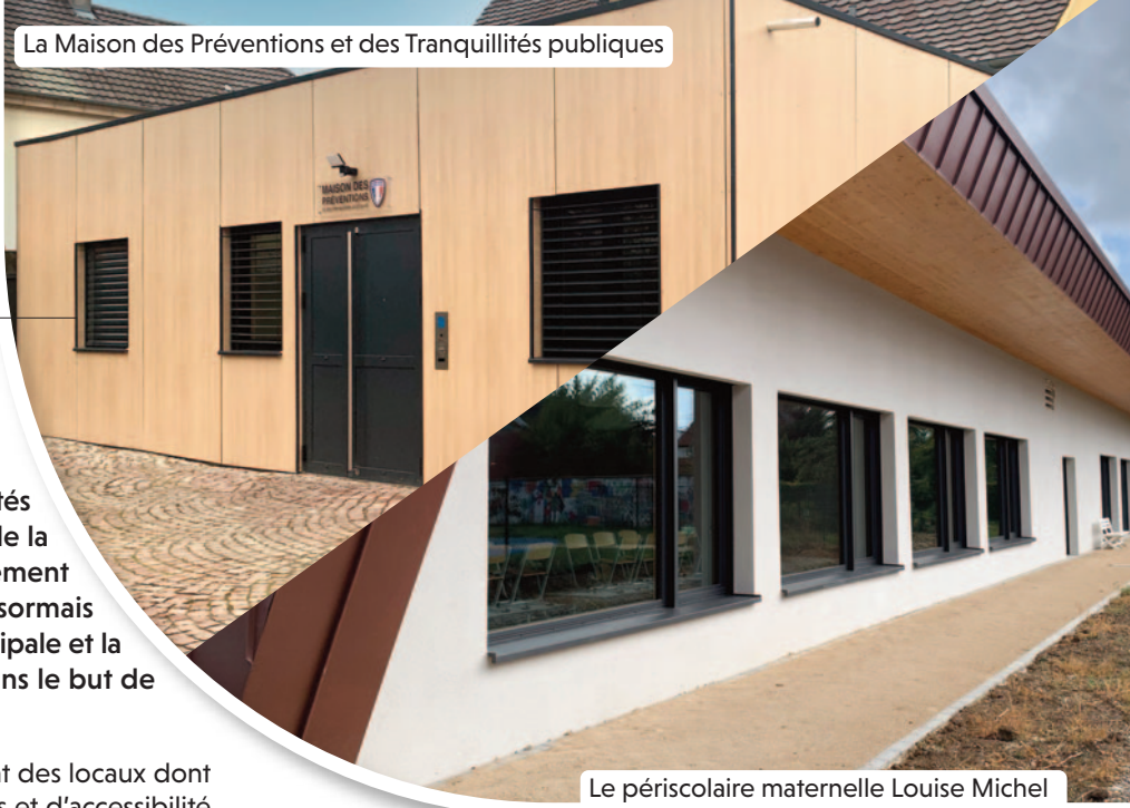
Le périscolaire maternelle Louise Michel

Il reçoit à Kingersheim uniquement sur rendez-vous, les lundis matin, tous les 15 jours.