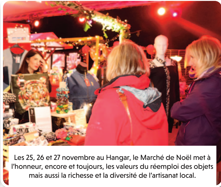
Les 25, 26 et 27 novembre au Hangar, le Marché de Noël met à l'honneur, encore et toujours, les valeurs du réemploi des objets mais aussi la richesse et la diversité de l'artisanat local.