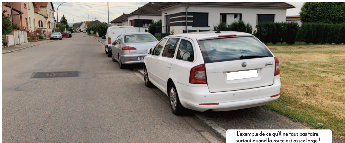
L'exemple de ce qu'il ne faut pas faire, surtout quand la route est assez large !

L'usage de plus en plus répandu de la voiture augmente les entraves à la circulation des autres usagers de la voie publique que sont les piétons et les cyclistes. En cause plus particulièrement le stationnement inapproprié ou dangereux provoquant souvent des situations conflictuelles très nuisibles à la qualité des relations de voisinage mais aussi passible d'une verbalisation. Du bon usage de l'espace public, Kingsheim Magazine dresse un petit tour d'horizon des règles à respecter.