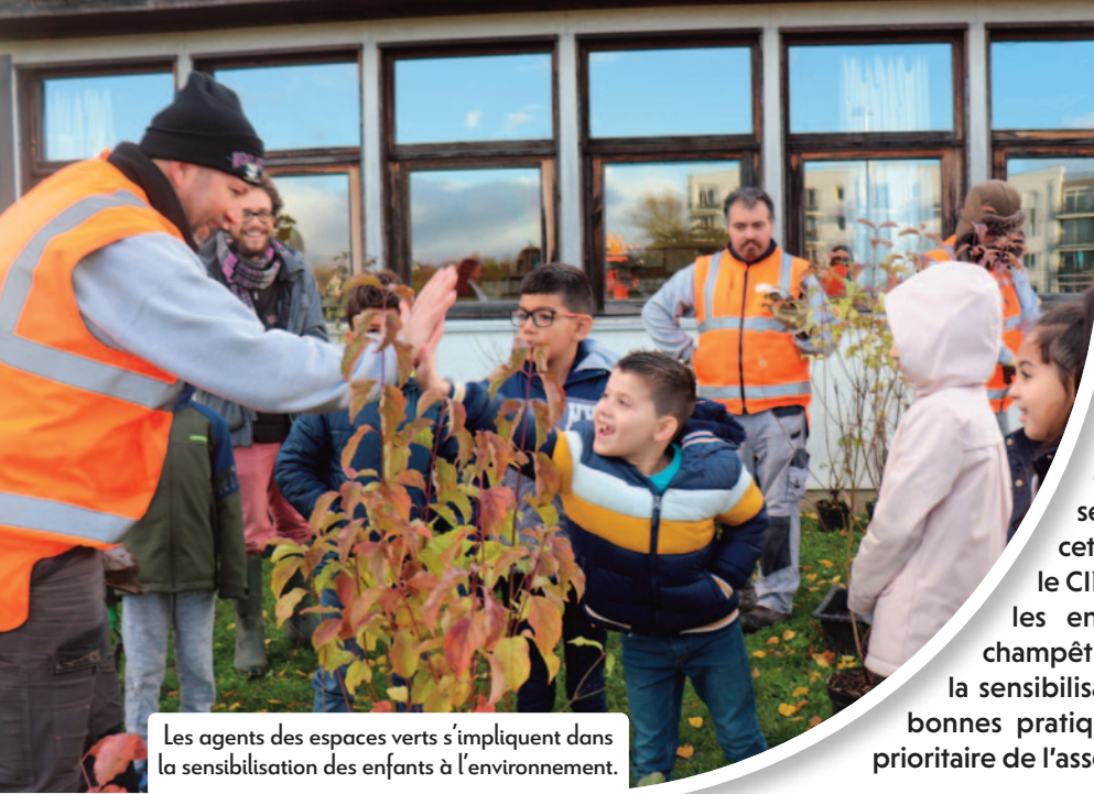
Les agents des espaces verts s'impliquent dans la sensibilisation des enfants à l'environnement.

La place de la nature en ville est une préoccupation centrale à Kingersheim. Elle peut compter sur le soutien actif de ses différents partenaires associatifs pour sensibiliser les habitants, enfants et adultes, à cet enjeu essentiel. Ainsi, à l'école Paul Claudel, le CINE de Lutterbach accompagne les élèves et les enseignants dans la création d'une haie champêtre. Un peu plus loin chez les Arboriculteurs, la sensibilisation et la formation du grand public aux bonnes pratiques environnementales constitue un axe prioritaire de l'association. Deux exemples concrets.