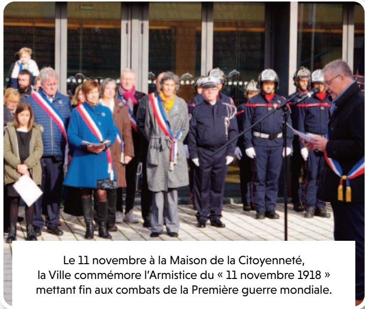
Le 11 novembre à la Maison de la Citoyenneté, la Ville commémore l'Armistice du « 11 novembre 1918 » mettant fin aux combats de la Première guerre mondiale.