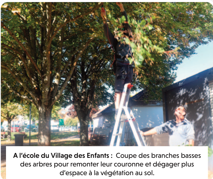
A l'école du Village des Enfants : Coupe des branches basses des arbres pour remonter leur couronne et dégager plus d'espace à la végétation au sol.