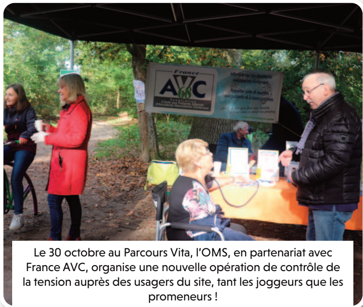
Le 30 octobre au Parcours Vita, l'OMS, en partenariat avec France AVC, organise une nouvelle opération de contrôle de la tension auprès des usagers du site, tant les joggeurs que les promeneurs !